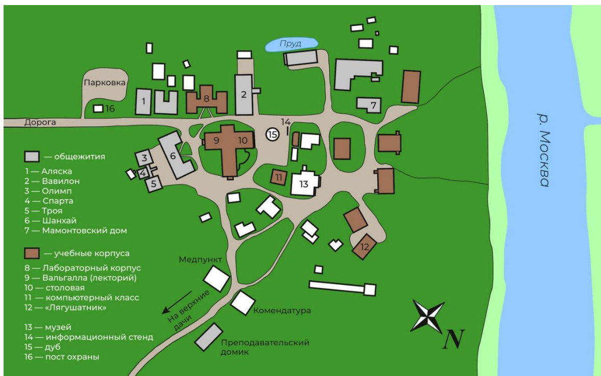
Схема ЗБС. Школа-конференция будет проходить в Лектории.